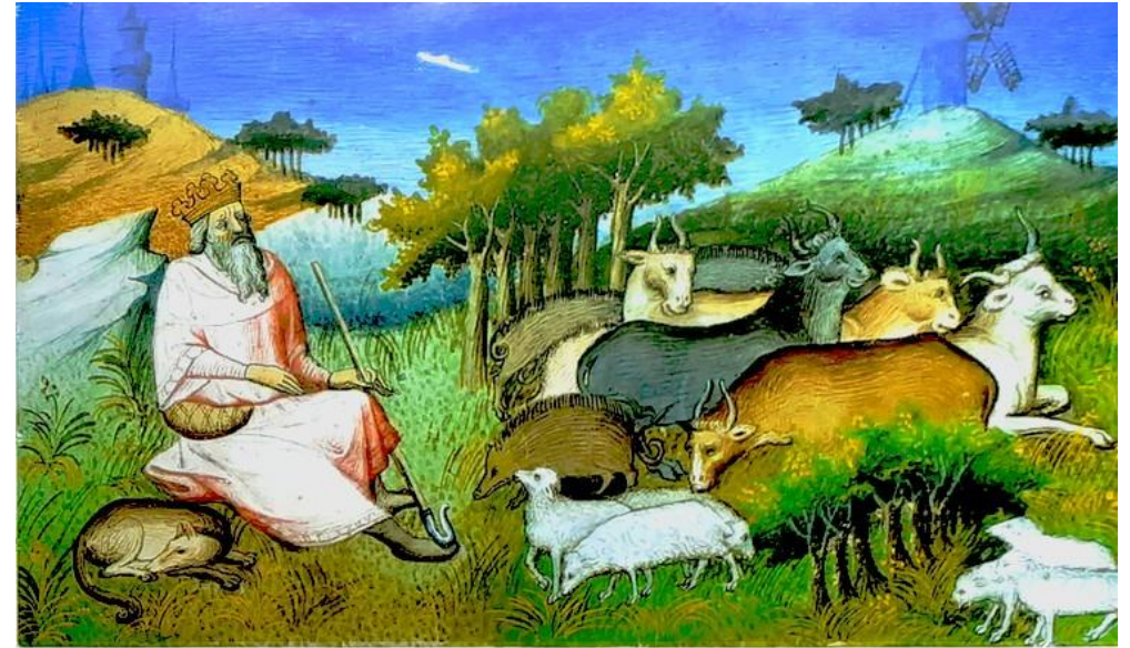
Le roi d'Or gardant ses troupeaux... composés d'animaux on ne peut plus ordinaires ! Marco Polo, Livre des Merveilles, 1410-1412. Paris, BnF, ms. fr. 2810, f° 50.